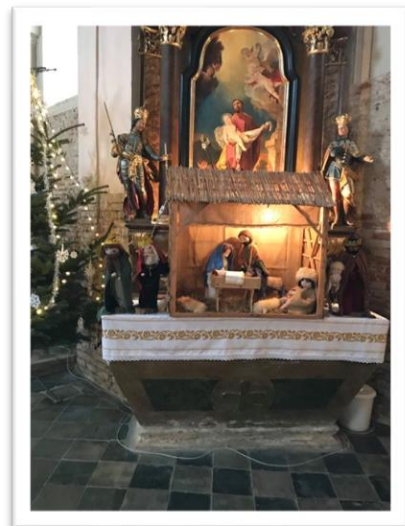
A Szent József mellékoltár a betlehemmel a rábahídvégi Szentháromság templomban