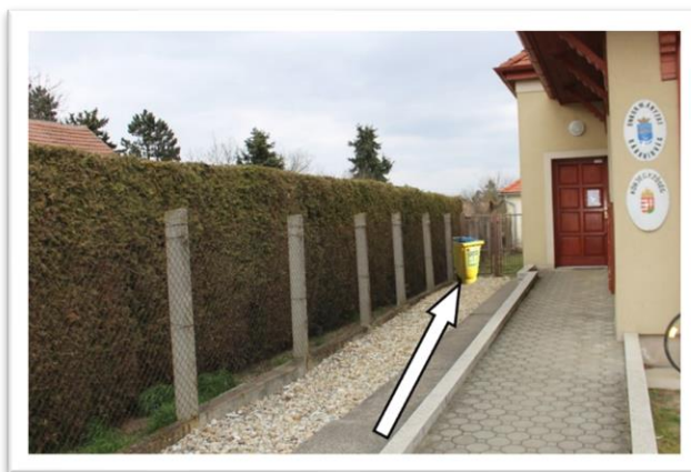
A használt sütóolaj és zsiradék gyűjtő tervezett helye (Bertha György u. 13.)