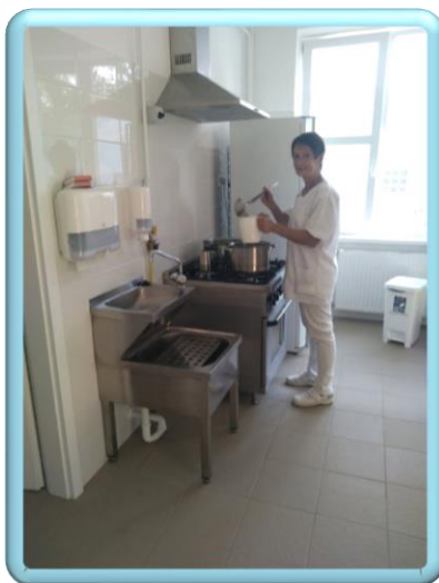
A megújult konyha

Az ősz beköszöntével nemcsak az iskolapadok teltek meg újra, benépesedett az óvoda is. Ebben az évben 32 gyermek veszi igénybe az óvodai ellátást. A kiscsoportosok száma 12 fő. Az első hetekben nagy hangsúlyt kapott az ismerkedés. Nemcsak egymással, hanem az óvoda helyiségeivel, szokásaival, az óvoda dolgozóival. Megismerték a napirendet, a szabályokat, amelyekhez szép lassan hozzászoktak. Igyekeztünk, hogy minél hamarabb kialakuljon a bizalom, ami majd mindenféle ismeretátadásnak az alapja lesz. Mindenki másképp élte meg ezt a helyzetet. Volt, aki élvezte az új helyet, az új játékokat, volt olyan, aki a galéria alá bújt, és csak szemlélődött, várt és sírdogált. Előbb-utóbb minden gyerek rádöbben, hogy most már itt, az óvodában tölti a napok nagy részét. Minden reggel, az elköszönés után fon-