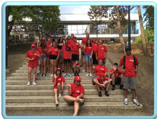
Nyári tábor Zánkán