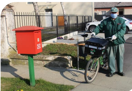
A posta most is megérkezik