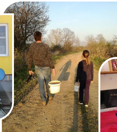
Szociális távolság 1,5 méter!