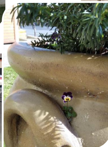
Az élet él és élni akar!