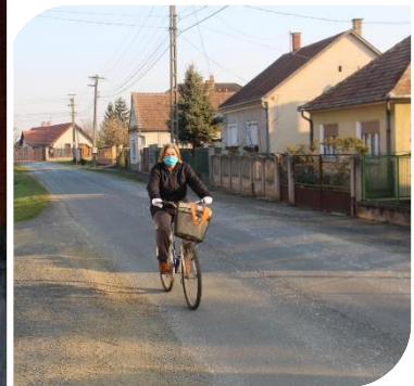
Kerékpáros a néptelen utcán