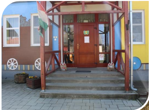
Üres az óvoda