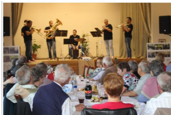
A Savaria Rézfúvós Együttes műsora