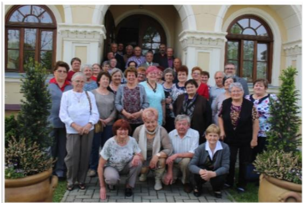
A 10 éves Őszirózsa Nyugdíjas Klub

Köszöntöttük névnapjukat ünneplő társainkat. Beültettük a gondozásunkban lévő virággruppot.