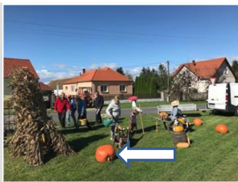
Az ominózus tök

Ezúton szeretnék bocsánatot kérni, hogy a település központjában létrehozott csodálatos kompozícióból meggondolatlanul eltulajdonítottam egy disztököt 2018. okt. végén, nem gondolva abba bele, hogy ezt a szép tököt egy helyi illetőségű személy 6 hónapig ide nevelte, gondozta, hogy falujukat ezzel szépítse és az itt lakó embereket