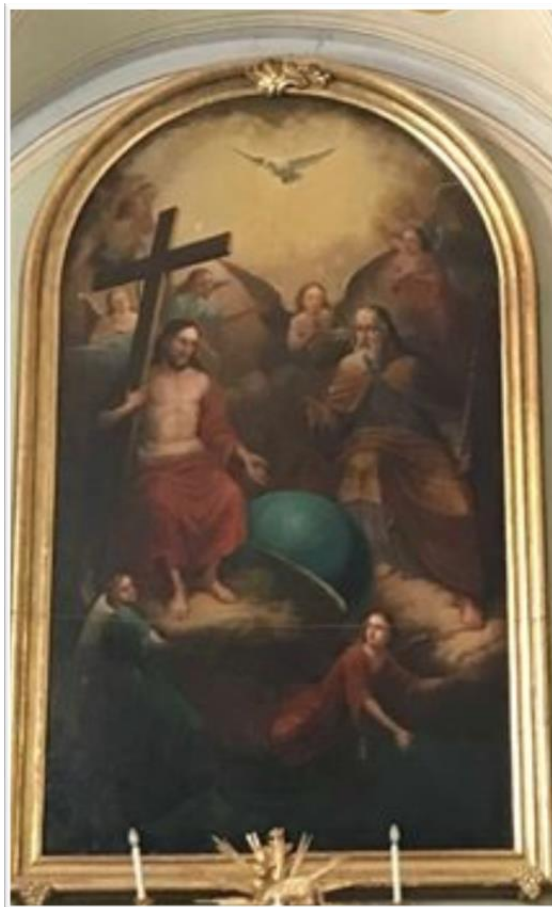
A rábahídvégi Szentháromság templom oltárképe