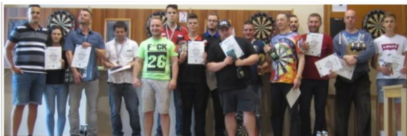
Az egyéni verseny díjazottjai