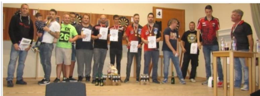
A páros verseny díjazottjai