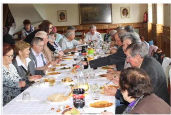
A jubileumi vacsora

Május 18-án ünnepeltük megalakulásunk 10. évfordulóját. Nagyon jól sikerült a rendezvény, melyet nagyon sok munka előzött meg. Köszönetemet fejezem ki elsősorban a klub asszonyainak a sok finom süteményért. Mindazoknak, akik bármilyen formában segítettek munkánkat. A sok felajánlásért (pálinka, bor, sör stb.).