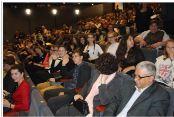
A Hevesi Sándor Színházban

Május 17-én 54 fővel mentünk a zalaegerszegi Hevesi Sándor Színházba , ahol az „ Abigél ” című darabot tekintettük meg. EFOP-os pályázatunknak köszönhetően a csoport fele olyan fiatalokból állt, akik valamelyik csoportunk tagjaként a művelődési ház tevékenységét segítik.