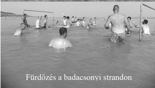
Fürdőzés a badacsonyi strandon