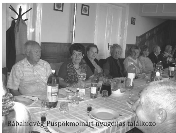
Rábahídvég-Püspökmolnári nyugdíjas találkozó