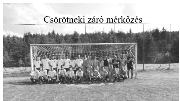
Csörötneki záró mérkőzés