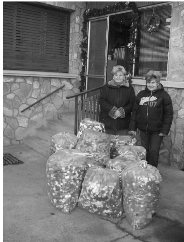
Hagyományainkat, tevékenységünket a 2011 - es évben is folytatjuk.