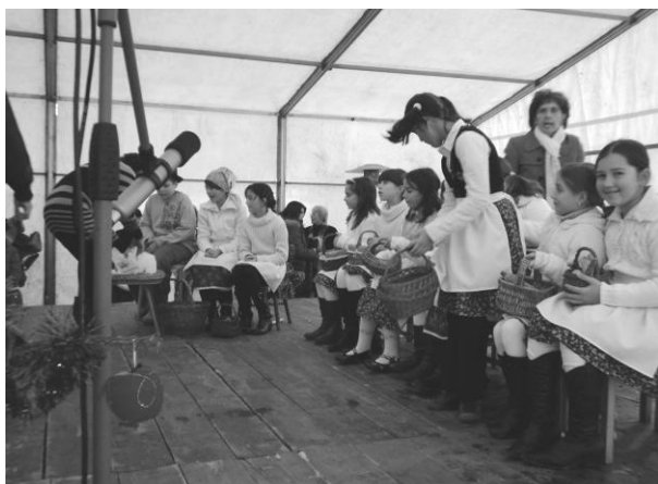
A 3-4. osztályosok a Karácsonyváro műsoron.