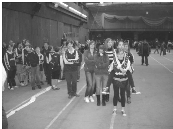
Csapatunk a Testnevelési Egyetem sportcsarnokában.