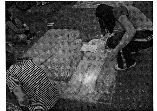
A felsős kategória győztes rajza