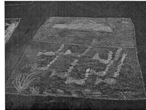
Az alsós kategória győztes rajza