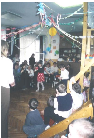
A nagysikerű farsangi műsor

Az ünnepekre való készülődés és az ünnep maradandó közös élményt jelent a gyerekeknek. Tréfás mondókákat, verseket tanultunk, énekeket daloltunk, álarcozat készítettünk, lufikat festettünk. A várva várt napon, húshagyó