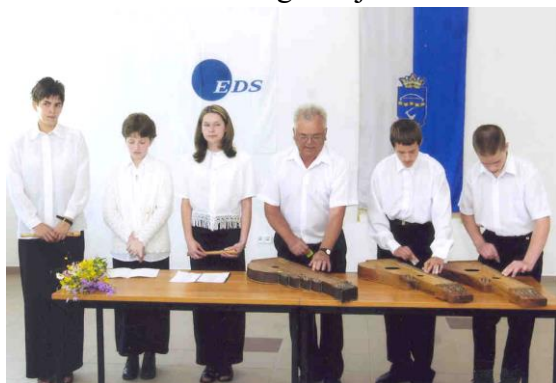
A Vadvirág együttes az épület avatásán

nagy munkavállalói körnek tudunk állást kínálni: egyrészt a középfokú végzettségű, felhasználói szintű számítástechnikai tudással rendelkező pályázóknak adatrögzítői munkát, másrészt a magasan képzett, felsőfokú végzettséggel, szakmai tapasztalattal bíró, idegen nyelven tárgyalóképes érdeklődőknek minőségibb állásokat. Az adatrögzítő jel-