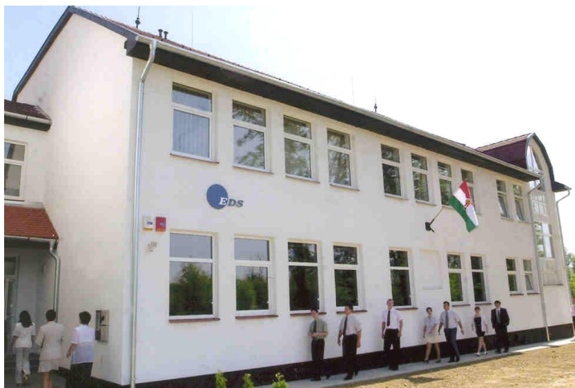
Az EDS rábahídvégi épülete az avatáskor