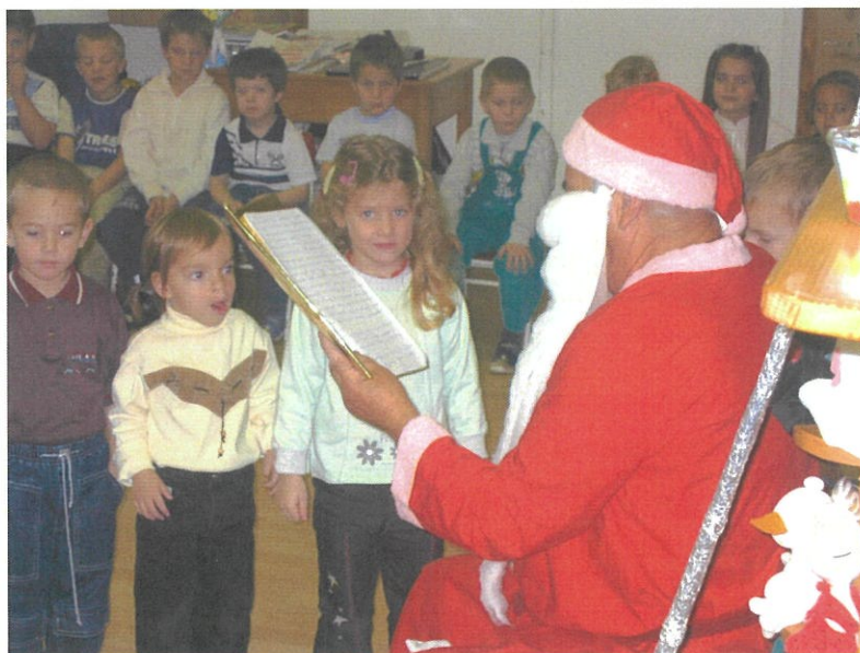
Megjött a Mikulás

Nagy kiterjedésű udvar veszi körül az óvodát, melyet a kor követelményeinek megfelelően igyekszünk állandóan alakítani (mozgásfejlesztő játékok készítése fából folyamatosan történik). Az udvar nagy része füvesített, de