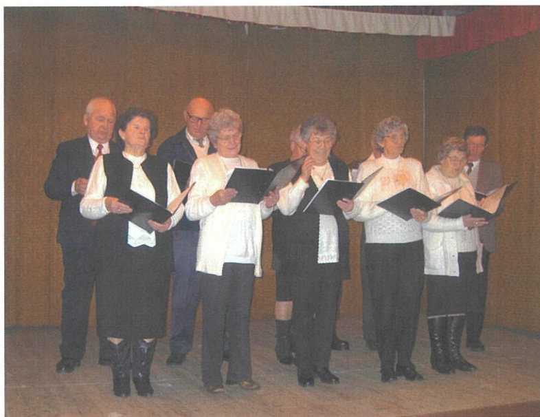
A nyugdíjas kör énekkara szereplés közben

Március 15-én, az ünnepi megemlékezésen műsorral járultunk hozzá a rendezvényhez. Részt vettünk községünk zászlószentelési átadásán, mű-