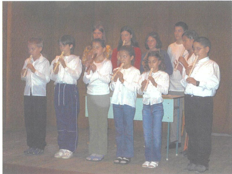
Furulyások a november 30-i kulturális bemutatón a művelődési házban

Sikeresen szerepeltek 3-4. osztályos gyerekeink Püspökmolnáriban a teremlabdarúgó kupán. A 7-8. osztályosok Vasváron a Suli Virtus rendezvényen első helyezést