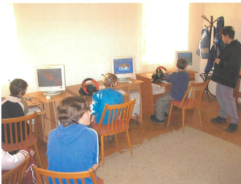
Gyermekek játszanak a teleház számítógépein

néhány játék is: autós, stratégiai, foci, repülő szimulátor-programok, kalandjátékok. Elérhető még néhány oktató- és kvízprogram is. A gépekhez van fejhallgató és