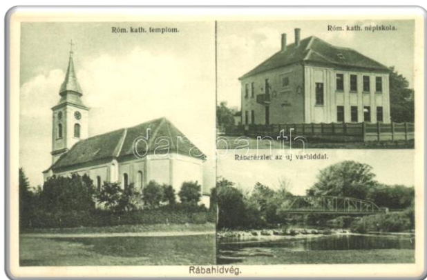
Korabeli képeslap Rábahídvégről

Az iskola frontján elhelyezett erkély tömegünnepken szószék szerepét tölti be előrelátó gondosságból.