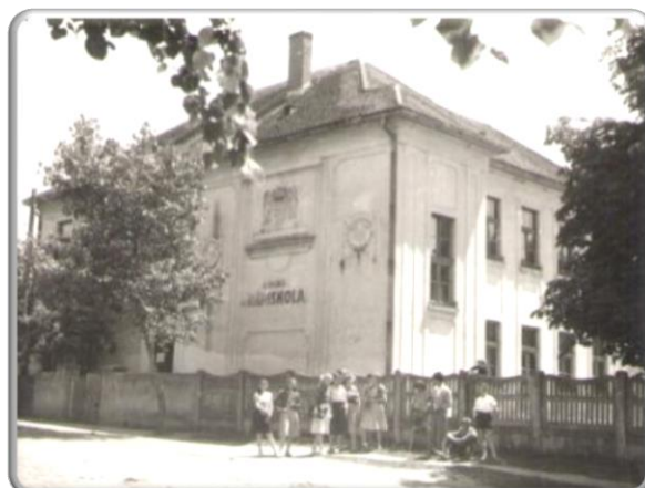
A rábahídvégi elemi iskola kibővített épülete