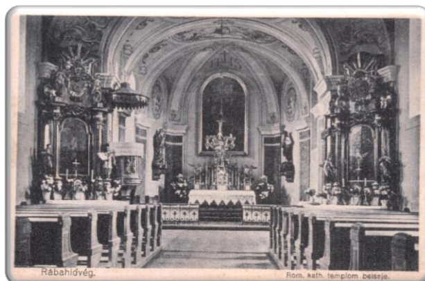
A rábahídvégi Szentháromság templom egykori belső tere

Ha kikapok is, elismerésemet fejezem ki a hidvégieknek és szellemi vezetőiknek! Nevüket nem sorolom fel, hisz ugyis tudja mindenki.