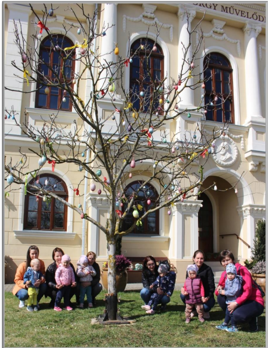
Csiribiri torna résztvevői

(A vers a Bertha György Művelődési Ház verspályá- zatára készült. A pályázatot a Költészet Napja alkalmából hirdettük meg iskolánk felső tagozato- sai körében.)