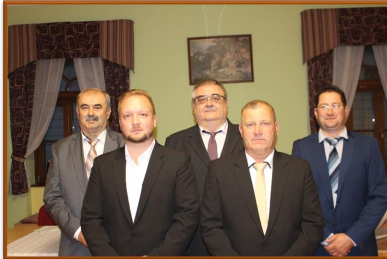
Az újonnan megválasztott képviselő testület tagjai:

a 99.750, - Ft-ot, egyedül élő háztartás esetén a 115.000, - Ft-ot és fatüzelésre alkalmas fűtőberendezéssel rendelkeznek. A kérelmek benyújtási határideje: 2024. november 15. A